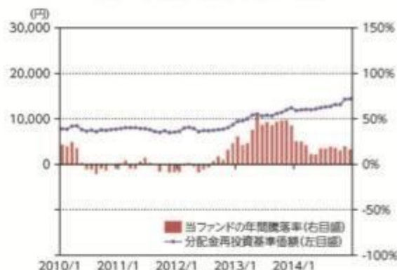
当ファンドの年間騰落率及び 分配金再投資基準価額の推移

*当ファンドの年間騰落率は、税引前の分配金を再投資したものとみなして計算した年間騰落率が記載されていますので、実際の基準価額に基づいて計算した年間騰落率とは異なる場合があります。