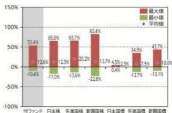
当ファンドと他の代表的な 資産クラスとの騰落率の比較

*2010年1月～2014年12月の5年間の各月末における直近1年間の騰落率の平均・最大・最小を、当ファンド及び他の代表的な資産クラスについて表示し、当ファンドと他の代表的な資産クラスを定量的に比較できるように作成したものです。他の代表的な資産クラス全てが当ファンドの投資対象とは限りません。