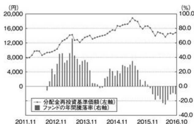
ファンドの年間騰落率及び 分配金再投資基準価額の推移