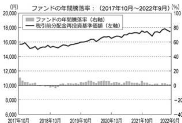
<ファンドの年間騰落率および分配金再投資基準価額の推移>