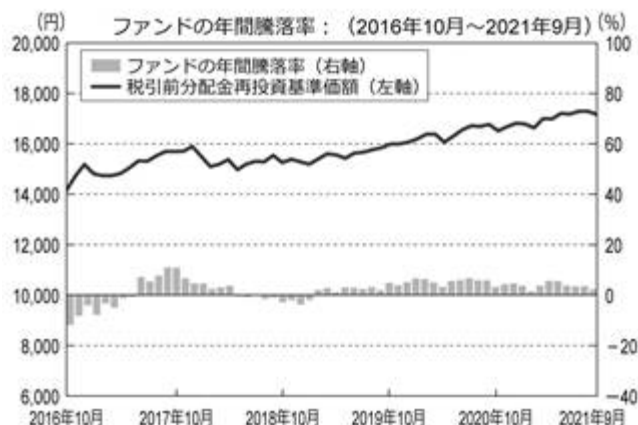
<ファンドの年間騰落率および分配金再投資基準価額の推移>