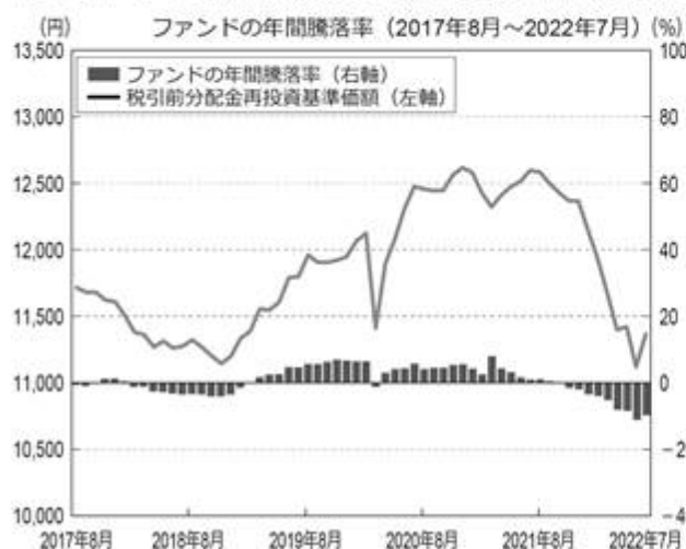
<ファンドの年間騰落率および分配金再投資基準価額の推移>