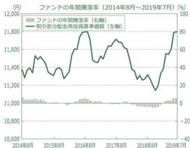
<ファンドの年間騰落率および分配金再投資基準価額の推移>