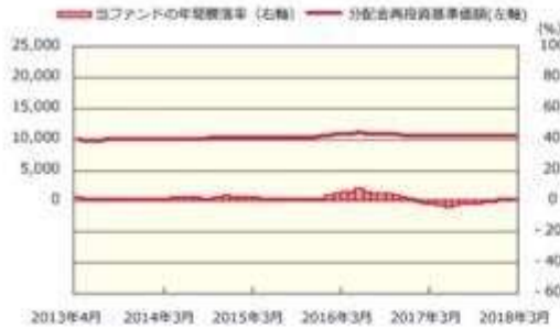
ファンドの年間騰落率および分配金再投資基準価額の推移