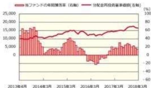
ファンドの年間騰落率および分配金再投資基準価額の推移