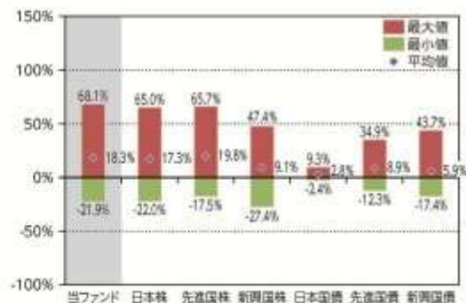
当ファンドと他の代表的な 資産クラスとの騰落率の比較

*2012年6月～2017年5月の5年間の各月末における直近1年間の騰落率の平均・最大・最小を、当ファンド及び他の代表的な資産クラスについて表示し、当ファンドと他の代表的な資産クラスを定量的に比較できるように作成したものです。他の代表的な資産クラス全てが当ファンドの投資対象とは限りません。