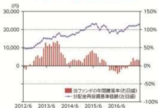
当ファンドの年間騰落率及び 分配金再投資基準価額の推移

*当ファンドの年間騰落率は、税引前の分配金を再投資したものとみなして計算した年間騰落率が記載されていますので、実際の基準価額に基づいて計算した年間騰落率とは異なる場合があります。