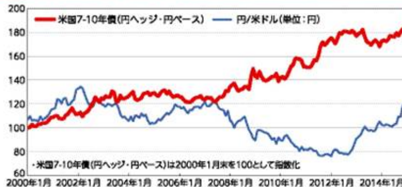
米国残存期間7～10年債(7-10年債)の累積リターンと円/米ドル (期間:2000年1月末～2015年1月末)

1 為替ヘッジを行うにあたっては、対象通貨間の金利差に基づくヘッジコストがかかります。また、債券投資による総合収益(債券価格の値動き+利子)は、債券価格の下落により損失となることがあります。