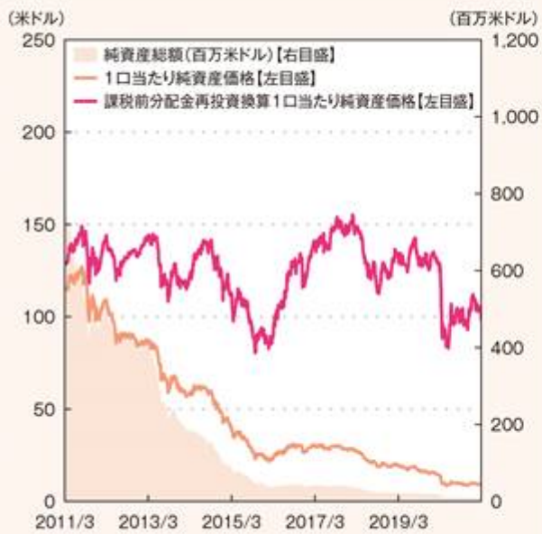
米ドル(ブラジルリアル・ヘッジ)ポートフォリオ