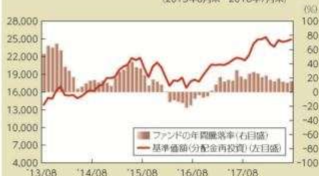
● ファンドの年間騰落率および基準価額(分配金再投資)の推移 (2013年8月末～2018年7月末)