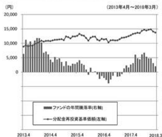
ファンドの年間騰落率と分配金再投資基準価額の推移