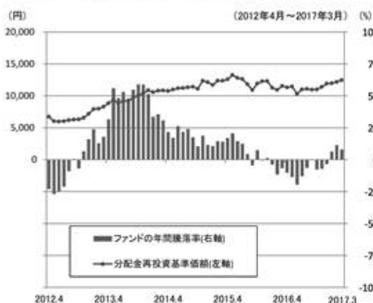
ファンドの年間騰落率と分配金再投資基準価額の推移