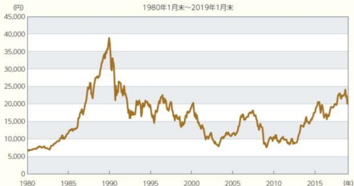
日経平均株価の推移(月末値)