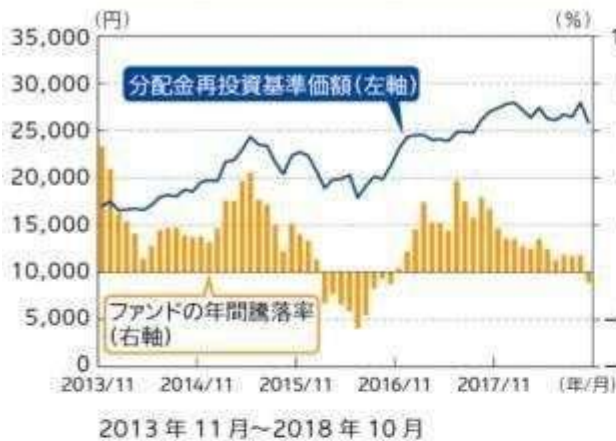
ファンドの年間騰落率及び 分配金再投資基準価額の推移