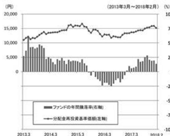
ファンドの年間騰落率と分配金再投資基準価額の推移