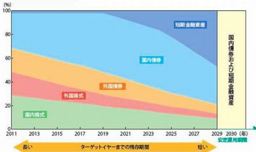
基本資産配分のイメージ図

※上記の図は、各決算時点での基本資産配分を表しています。2029年の決算日以降2030年の決算日までは、安定運用期間に向けて、順次、国内株式、外国株式および外国債券への配分を低減していきます。