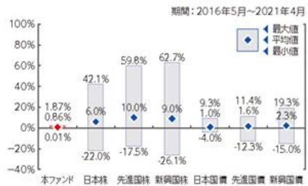
ファンドと他の代表的な 資産クラスとの騰落率の比較

●グラフは、ファンドと代表的な資産クラスを定量的に比較できるように作成したものです。