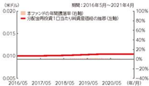
ファンドの年間騰落率および 分配金再投資1口当たり純資産価格の推移