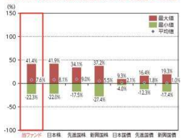
当ファンドと他の代表的な資産クラスとの騰落率の比較

*2014年12月～2019年11月の5年間の各月末における直近1年間の騰落率の平均・最大・最小を、当ファンド及び他の代表的な資産クラスについて表示し、当ファンドと他の代表的な資産クラスを定量的に比較できるように作成したものです。他の代表的な資産クラス全てが当ファンドの投資対象とは限りません。