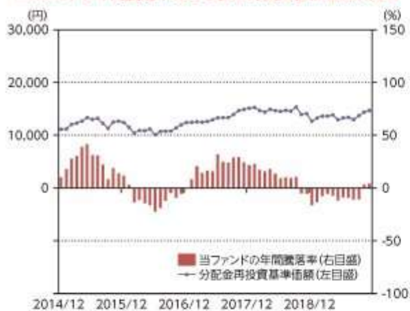
当ファンドの年間騰落率及び分配金再投資基準価額の推移

*当ファンドの年間騰落率は、税引前の分配金を再投資したものとみなして計算した年間騰落率が記載されていますので、実際の基準価額に基づいて計算した年間騰落率とは異なる場合があります。