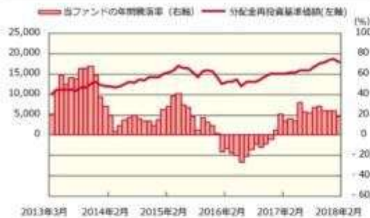
ファンドの年間騰落率および分配金再投資基準価額の推移