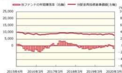
ファンドの年間騰落率および分配金再投資基準価額の推移