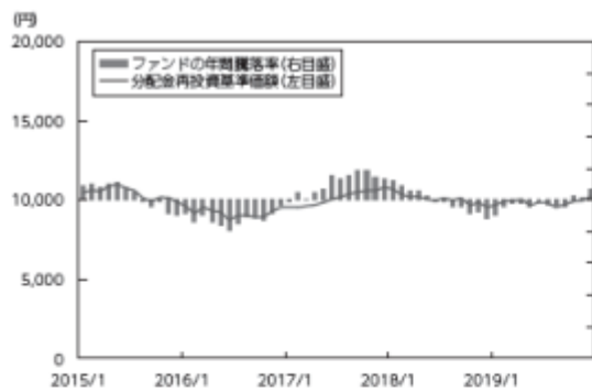
&lt;年間騰落率および分配金再投資基準価額の推移&gt;