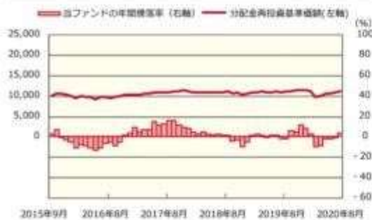
ファンドの年間騰落率および分配金再投資基準価額の推移