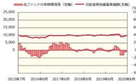
ファンドの年間騰落率および分配金再投資基準価額の推移