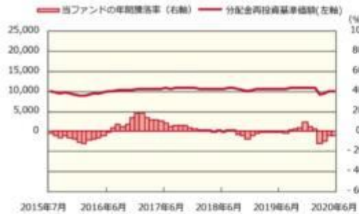
ファンドの年間騰落率および分配金再投資基準価額の推移