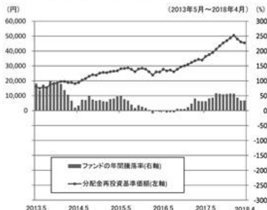
ファンドの年間騰落率と分配金再投資基準価額の推移