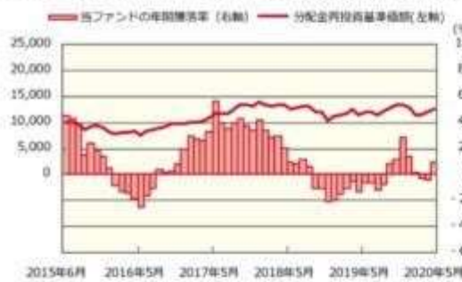
ファンドの年間騰落率および分配金再投資基準価額の推移