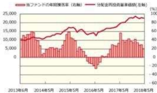
ファンドの年間騰落率および分配金再投資基準価額の推移