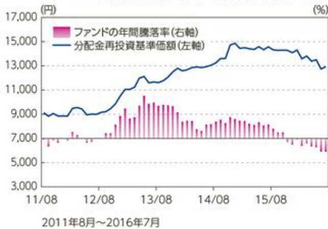
ファンドの年間騰落率及び分配金再投資基準価額の推移