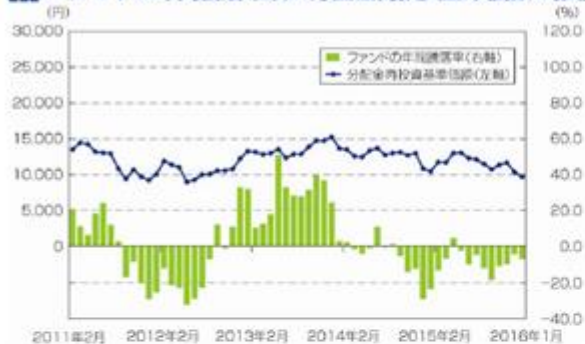
■ ファンドの年間騰落率及び分配金再投資基準価額の推移