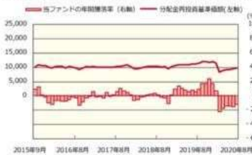
ファンドの年間騰落率および分配金再投資基準価額の推移