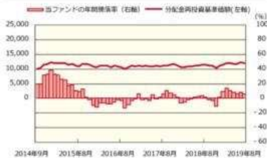
ファンドの年間騰落率および分配金再投資基準価額の推移