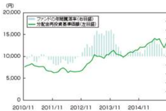
&lt;年間騰落率及び分配金再投資基準価額の推移&gt;