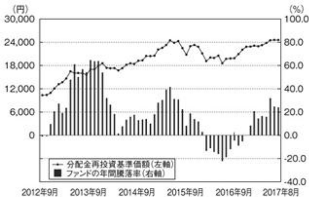
ファンドの年間騰落率および分配金再投資基準価額の推移