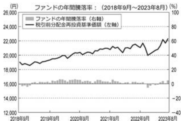
<ファンドの年間騰落率および分配金再投資基準価額の推移>