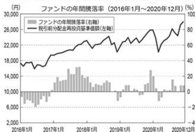
<ファンドの年間騰落率および分配金再投資基準価額の推移>