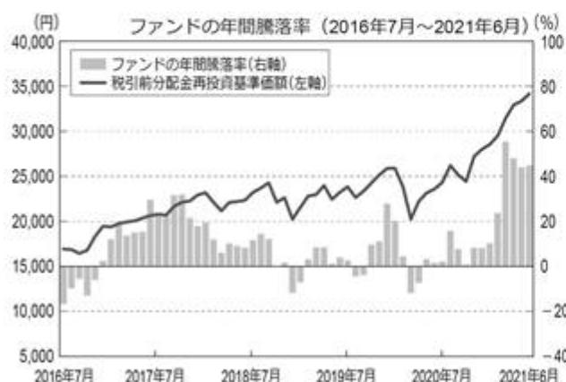
＜ファンドの年間騰落率および分配金再投資基準価額の推移＞