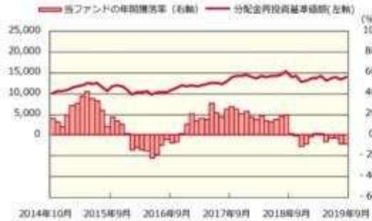
ファンドの年間騰落率および分配金再投資基準価額の推移