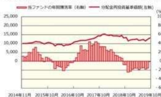
ファンドの年間騰落率および分配金再投資基準価額の推移