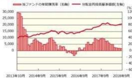
ファンドの年間騰落率および分配金再投資基準価額の推移