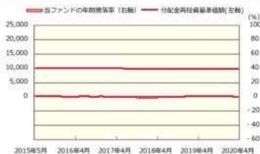
ファンドの年間騰落率および分配金再投資基準価額の推移