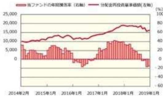
ファンドの年間騰落率および分配金再投資基準価額の推移