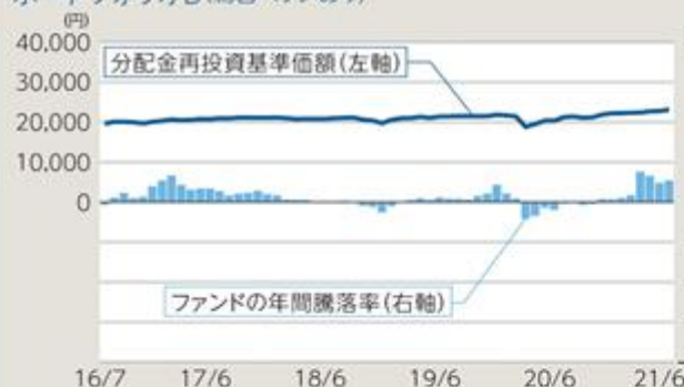
ポートフォリオB(為替ヘッジあり)