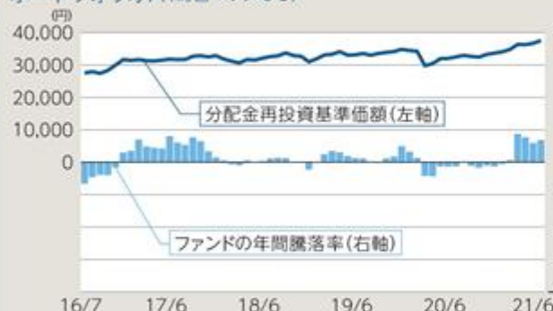
ファンドの年間騰落率及び分配金再投資基準価額の推移 ポートフォリオA(為替ヘッジなし)