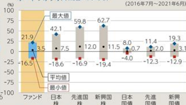
ファンドと他の代表的な資産クラスとの騰落率の比較 ポートフォリオA(為替ヘッジなし)