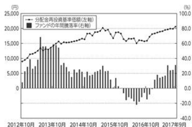
ファンドの年間騰落率および分配金再投資基準価額の推移