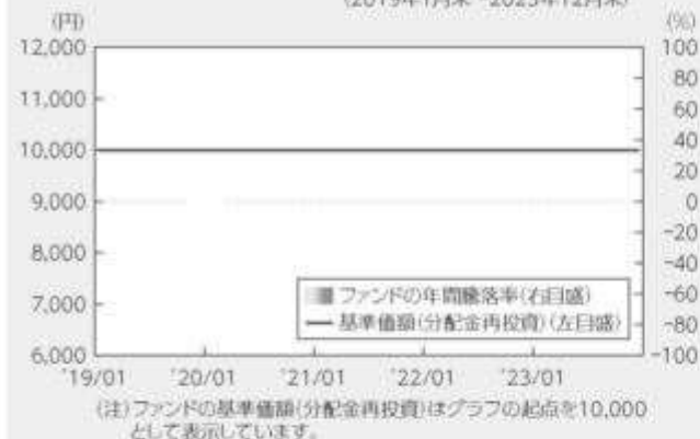
● ファンドの年間騰落率および基準価額(分配金再投資)の推移 (2019年1月末～2023年12月末)