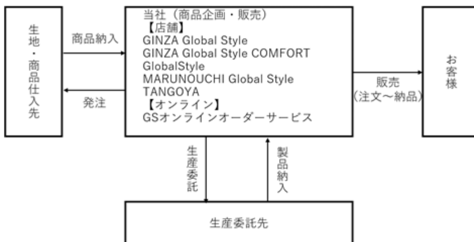
[ 事業系統図 ]