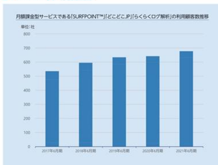
■ IP Geolocation事業 利用顧客数推移