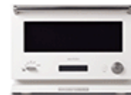
BALMUDA The Toaster