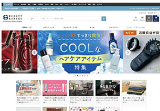
パソコン用サイト