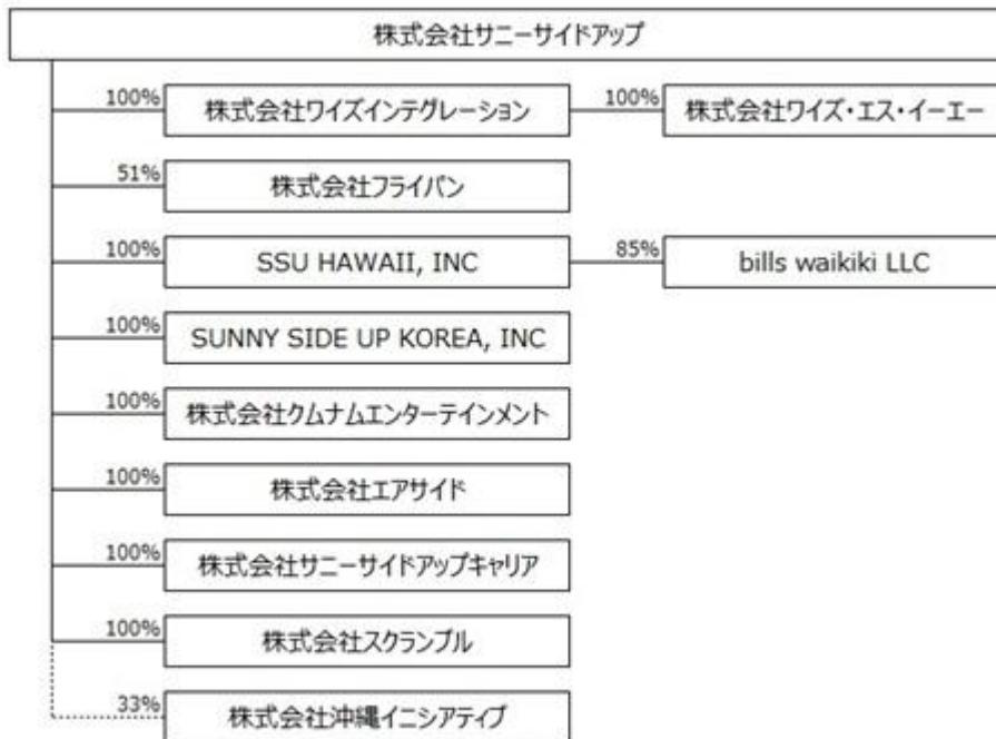
当社グループ会社構成図

当社グループのビジネスは大きく2つに分類されます。一つは、従来型の「受託型ビジネス」であり、企業・団体を顧客としてPR・プロモーション（店頭販促）・デジタルといった統合的なマーケティングサービスを提供するビジネスです。一方は、今後の成長領域である「創造型ビジネス」であり、「bills事業」と好例として、これまで培ってきたマーケティングノウハウ及びグローバルな人的・情報ネットワークを活用して新規事業創造を行うものであります。