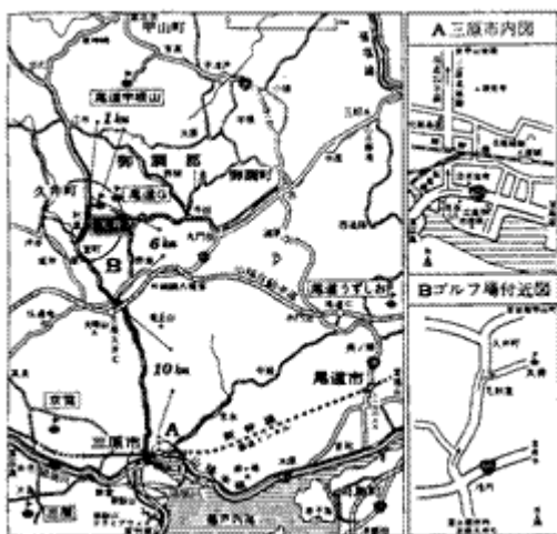
久井カントリークラブ案内図